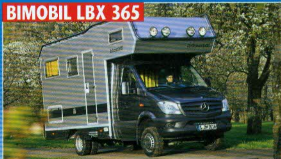
BIMOBIL LBX 365